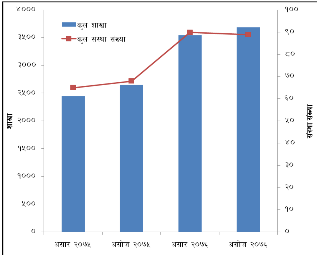
चित्र १: लघुवित्त संस्था र शाखा संख्या

२. प्रदेशगत रुपमा हेर्दा सबभन्दा बढी लघुवित्त वित्तीय संस्थाहरूको शाखा प्रदेश नं ५ मा रहेको देखिन्छ । २०७६ असोज मसान्तसम्ममा उक्त प्रदेशमा ८०७ वटा लघुवित्त वित्तीय संस्थाहरूको शाखा संचालनमा रहेका छन् । तत्पश्चात लघुवित्त वित्तीय संस्थाहरूको धेरै शाखा भएको प्रदेशमा प्रदेश नं २ रहेको छ । सबभन्दा कम कर्णाली प्रदेशमा १७० वटा लघुवित्त वित्तीय संस्थाहरूको शाखा रहेका छन् ।