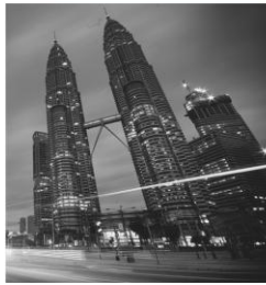
The South East Asian Central Banks Research and Training Centre