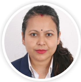
सिर्जना क्षेत्री सहायक निर्देशक