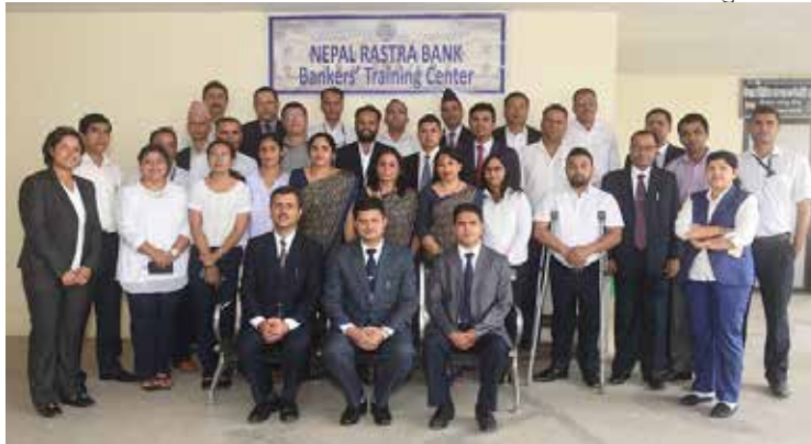
व्यवस्थापन विकास कार्यक्रम विषयक तालिमका सहभागीहरू

यस अघि केन्द्रले २०७५ भदौ ३ देखि ८ गतेसम्म अधिकृत स्तरीय व्यवस्थापन विकास कार्यक्रम (Management Development Program) विषयक तालिम आयोजना गरेको थियो ।