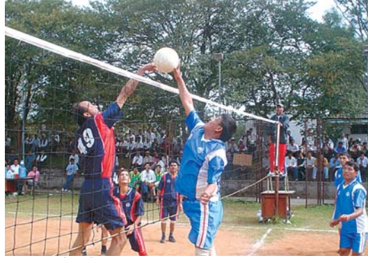
फाइनल खेलको एक दृश्य।

फाइनलमा पुगेको जनशक्ति व्यवस्थापन विभाग तेस्रो सेटमा पनि २५-१३ को स्कोरमा पाखा लाग्यो।