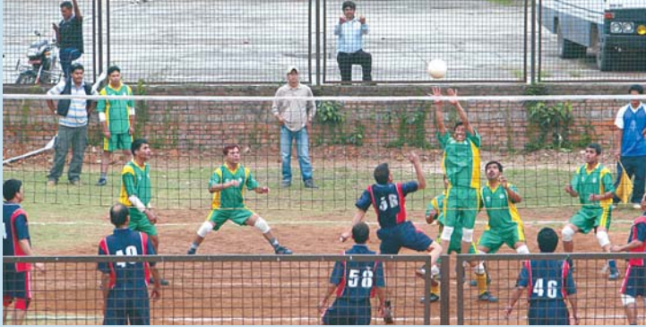
अन्तरविभागीय भलिबल प्रतियोगिता अन्तर्गत मुद्रा व्यवस्थापन विभाग र बैंकिङ्ग कार्यालयबीच भएको खेलको एक दृश्य ।